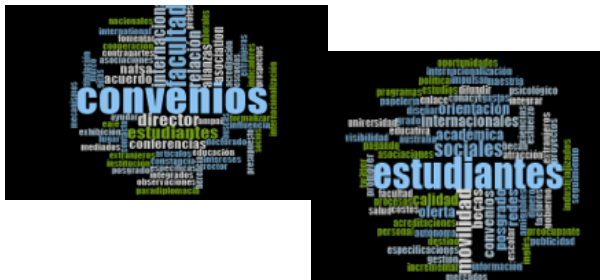
Figura 3. Convenios.

Elaboración propia a través de software Nvivo.