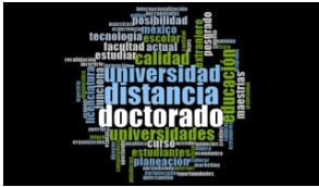
Figura 1. Educación a distancia.